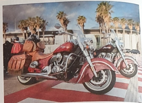
La Corsica, c'est un rendez-vous intime et chic.